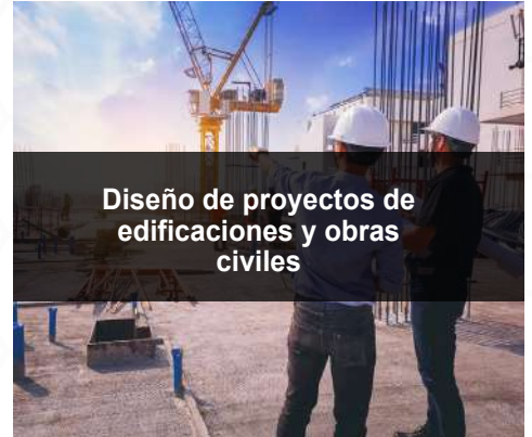
Diseño de proyectos de edificaciones y obras civiles