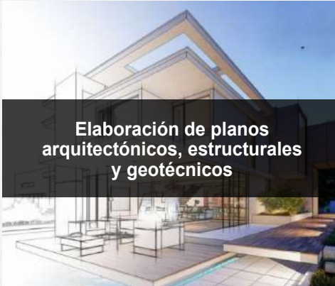
Elaboración de planos arquitectónicos, estructurales y geotécnicos

proceso sistemático de definir objetivos, alcance, recursos y cronogramas para convertir una idea en un resultado concreto. Involucra diagnosticar necesidades, establecer tareas, asignar responsabilidades y prever riesgos para garantizar la ejecución exitosa