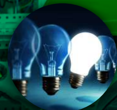
Innovación y Mejora Continua