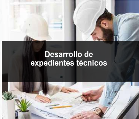
Desarrollo de expedientes técnicos