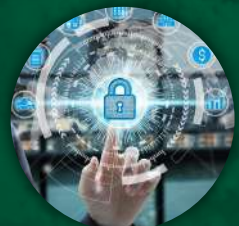
Compromiso con la Excelencia

Ser una empresa líder y referente en el sector de ingeniería eléctrica y construcción, reconocida por la excelencia en el desarrollo de proyectos, la confiabilidad de nuestros servicios y la capacidad de ofrecer soluciones tecnológicas innovadoras en sistemas eléctricos, obras civiles y automatización, aportando al desarrollo sostenible y al uso eficiente de la energía.